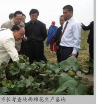
张副市长考察陕西棉花生产基地

张副市长在调研时还指出:生物技术有巨大市场前景,市政府将根据《深圳生物产业振兴发展规划》及配套政策,优先扶持生物产业发展。同时指出,对于生物农业高新技术企业,在认定总部经济企业时,要针对农业行业特点制定相应的政策,尽快培育全国行业领先的生物农业企业,促进深圳生物产业基地建设。(文/黄涛) (文章转自香港商报2009年9月29日第B7版)